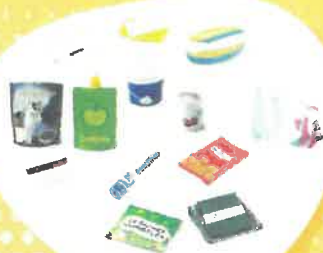
Plastiques : Barquette, Sachet, Film...