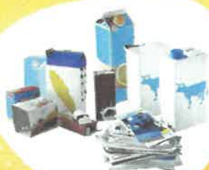
Papier et Carton : Jounaux, Brique, Cartonnette...