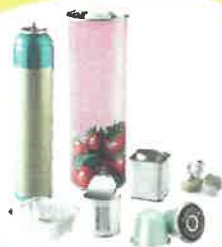
Métaux : Canette, Conserve, Aérosol...