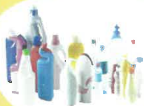
Plastiques : Bouteille, Flacon, Bidon...